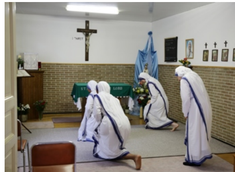
De zusters zijn om 4.40 uur al uit de veren voor het ochtendgebed.

De zusters schuimen daarnaast heel Gent af om te bidden, bijvoorbeeld in ziekenhuizen en bij daklozen. Ook in de donkere hoekjes van de