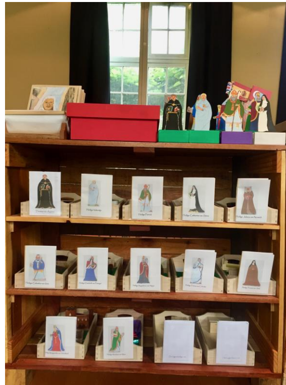
De kast van Pinksteren en de verhalen van de heiligen

Links van de parabelkasten staat er een kast met verhalen die zich afspelen na de dood en verrijzenis van Jezus: een reeks verhalen over de verschijningen van Jezus, het mysterie van Pinksteren en, nog veel later, de verhalen over de (gemeenschap van de) heiligen.