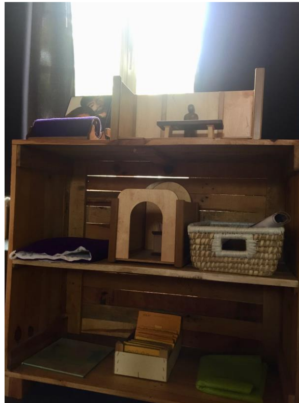
De paaskast in de Oude Abdij van Drongen

De paaskast bevindt zich, wanneer je naar de focuskast kijkt, rechts ervan. Dit zijn de verhalen die ons leiden naar een einde, dat tegelijk een nieuw begin is.