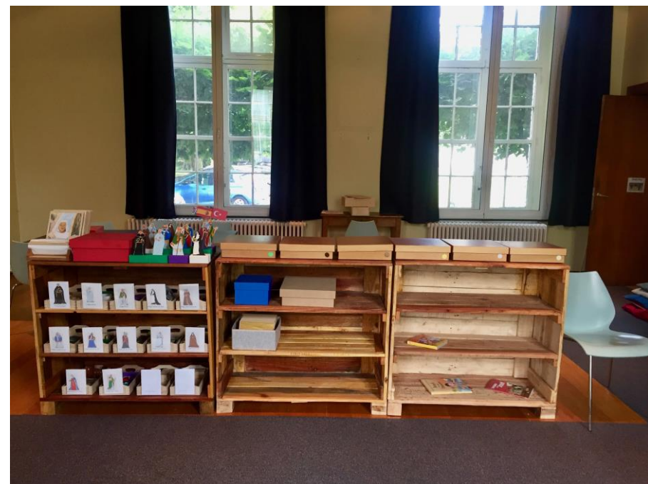
De kast met verhalen van na de verrijzenis leunt aan bij de parabelkasten (Oude Abdij van Drongen,)