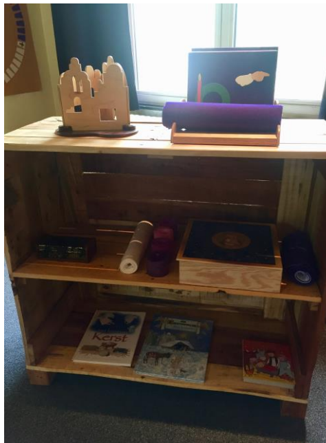
De kerstkast in de Oude Abdij van Drongen

De verhalen over advent en epifanie gebruiken ook de figuren van de heilige Familie.