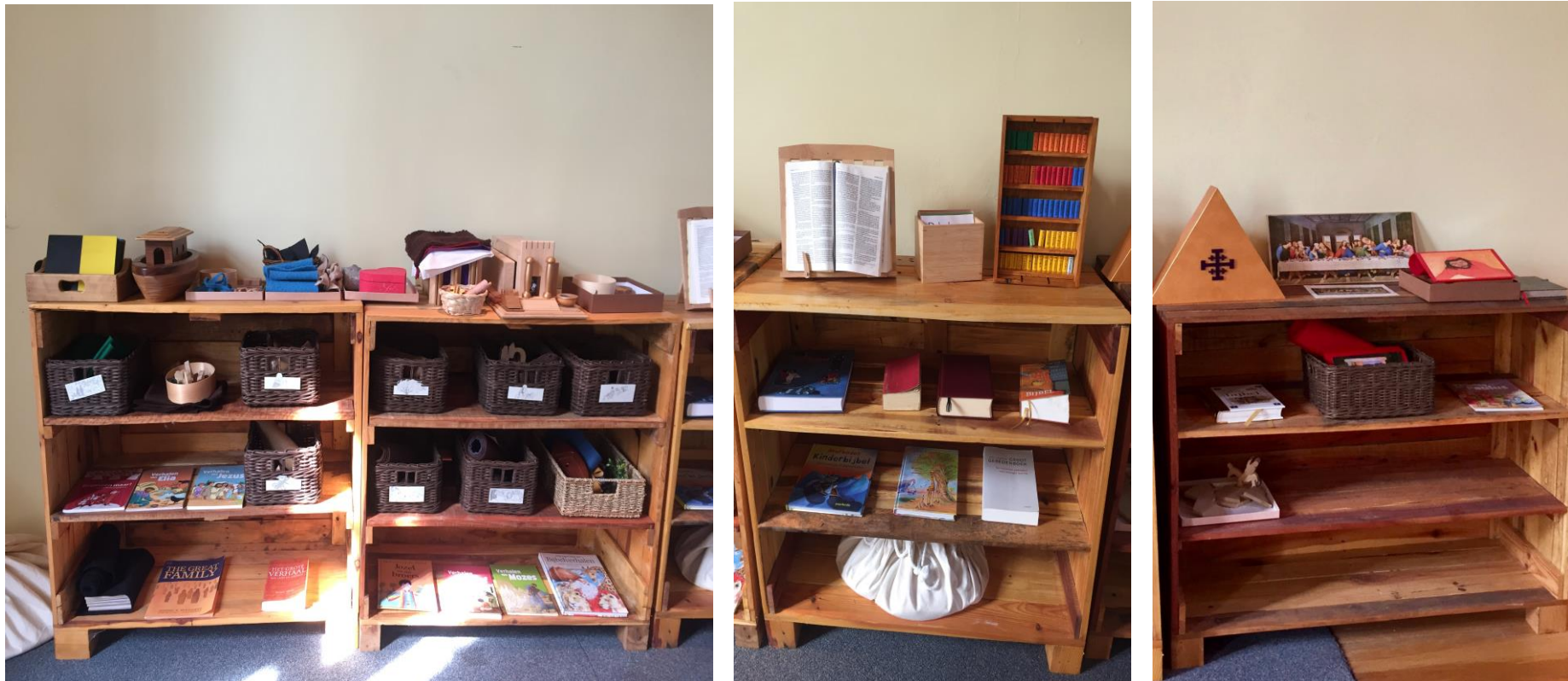
De kasten met heilige verhalen en transitiekast in de Oude Abdij van Drogen

Tussen de kasten met verhalen uit het Oude Testament en de kasten met verhalen uit het Nieuwe Testament staat de transitiekast. In het schema kreeg de inhoud van deze kast een grijze kleur.