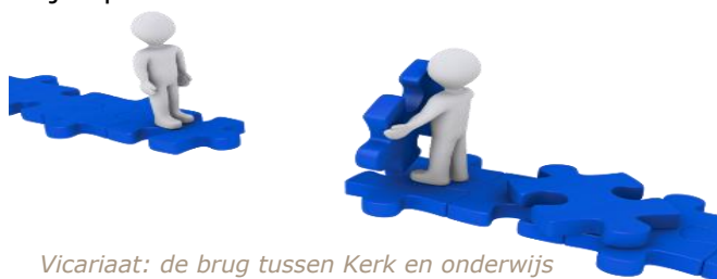
Vicariaat: de brug tussen Kerk en onderwijs

Het Vicariaat Onderwijs is een dienst van de bisschop en is verantwoordelijk voor de regionale coördinatie en ondersteuning van de dienstverlening, belangenbehartiging en representatie van de besturen van alle katholieke (hoge)scholen, internaten en centra voor volwassenonderwijs op lokaal vlak en Vlaanderenbreed.