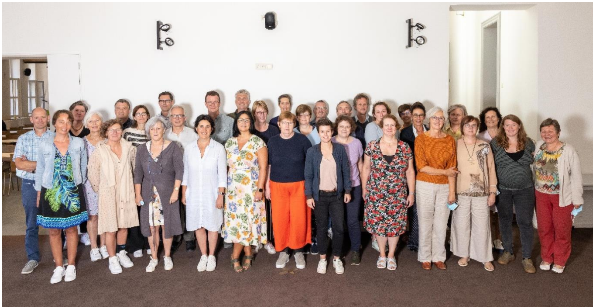
Op de startdag in september komen de pedagogische begeleiders samen met de andere diensten van het vicariaat.

Globaal gezien hebben we vooral bij dit prioritair werkpunt belangrijke stappen vooruit gezet in 2021. De samenwerking tussen pedagogische begeleiding en vicariaat is intenser en opener. Er is een gezonde reflex om minder individueel te werk te gaan en het brede team en de verschillende diensten te betrekken in de ondersteuning van schoolteams en besturen. Identiteit wordt sterker gezien als een gedeelde verantwoordelijkheid. Er is meer openheid en een grotere betrokkenheid op elkaars werking.