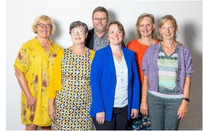
Inspecteurs Rooms-Katholieke Godsdienst

Zo was er een thematisch vicariaal overleg waar vanuit de godsdienstinspectie het voorstel werd gelanceerd om volgend schooljaar een traject te gaan met directies en schoolteams. Tijdens dit traject wil men nadenken over de toekomst en de kwaliteit van het vak rooms-katholieke godsdienst. In het vicariaal overleg werd vanuit verschillende perspectieven nagedacht over de rol en betrokkenheid van schoolbegeleiding, dienst identiteit, schoolbesturen en bisschoppelijk gedelegeerde.