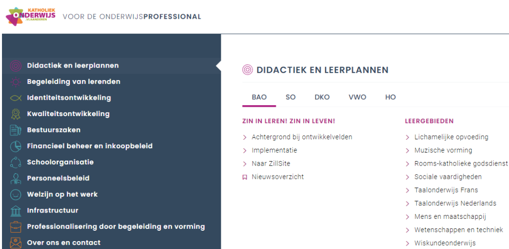
De vernieuwde PRO.-website van KathOndVla

We zorgen voor toegankelijke regionale informatie via de vernieuwde PRO.-website van Katholiek Onderwijs Vlaanderen.