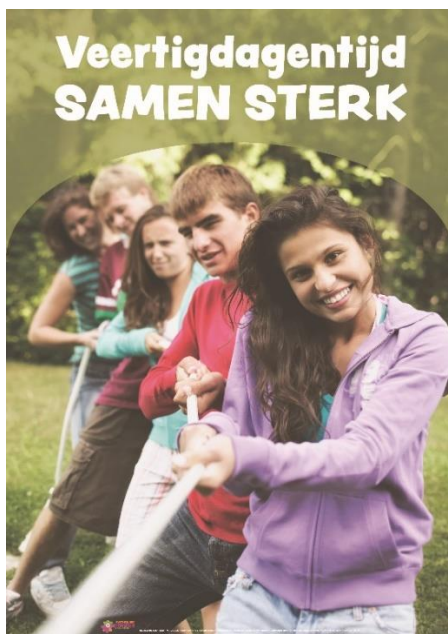
Samen staan we sterk

Iedere dag opnieuw gaan we op weg met jongeren en collega's. Samen met hen leggen we een stukje van hun weg in persoonlijke groei af. In die relatie proberen we een vertrouwensband op te bouwen.