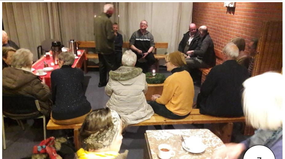
Koffie en thee na de mis

De gemeenschap omvat ook de kring van mensen die heel gevarieerd is en die zich, in meer of minder mate, engageren om deel te nemen aan de vieringen en aan alles wat onze gemeenschap aanbiedt. Met vele van hen hebben we een traditie van jarenlange verbondenheid, anderen hebben recent kennisgemaakt met het gebeuren. Allen zien we als één grote familie van broers en zussen.