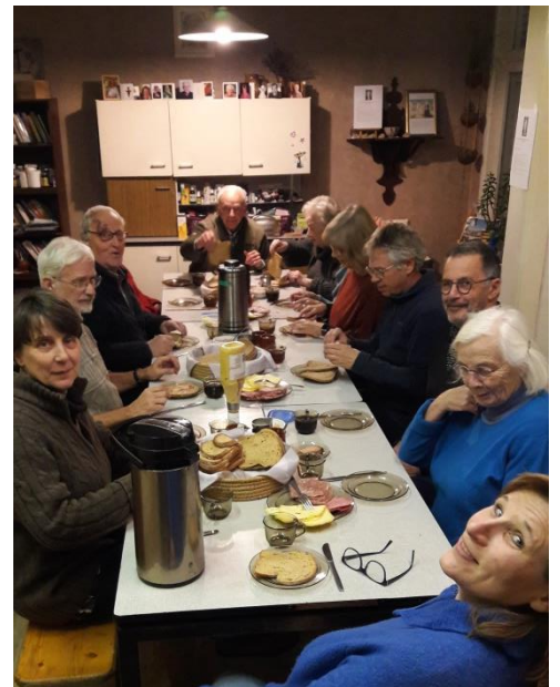
Eten voor de mis

De avond wordt afgesloten met een tas koffie of thee en een soms lang uitlopend ontmoetingsmoment.