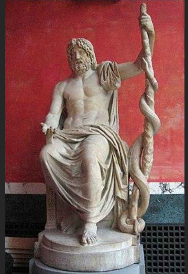
Epidauros – heiligdom Asklepios