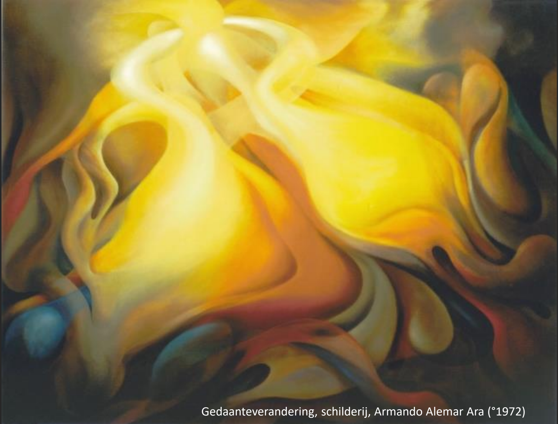
Gedaanteverandering, schilderij, Armando Alemar Ara (°1972)