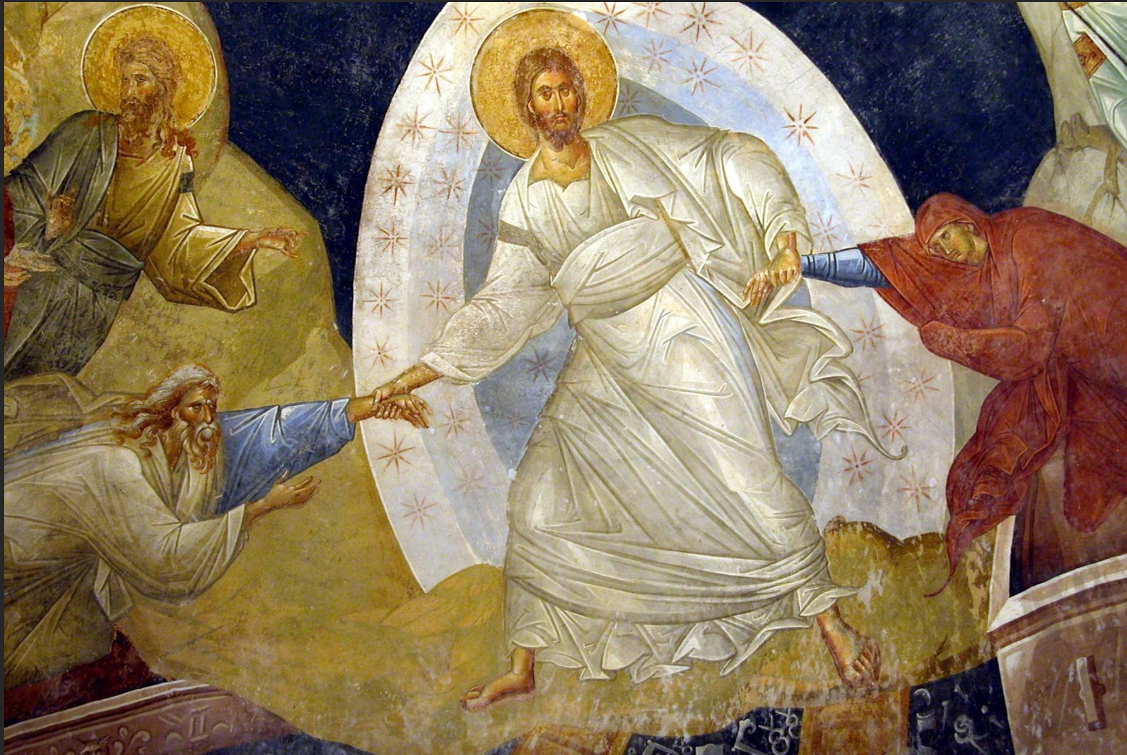
Verrijzenis, fresco, Chora-kerk Istanbul. Detail

Kern van elk wonder: God legt (in Jezus) de chaos aan banden (Pasen)