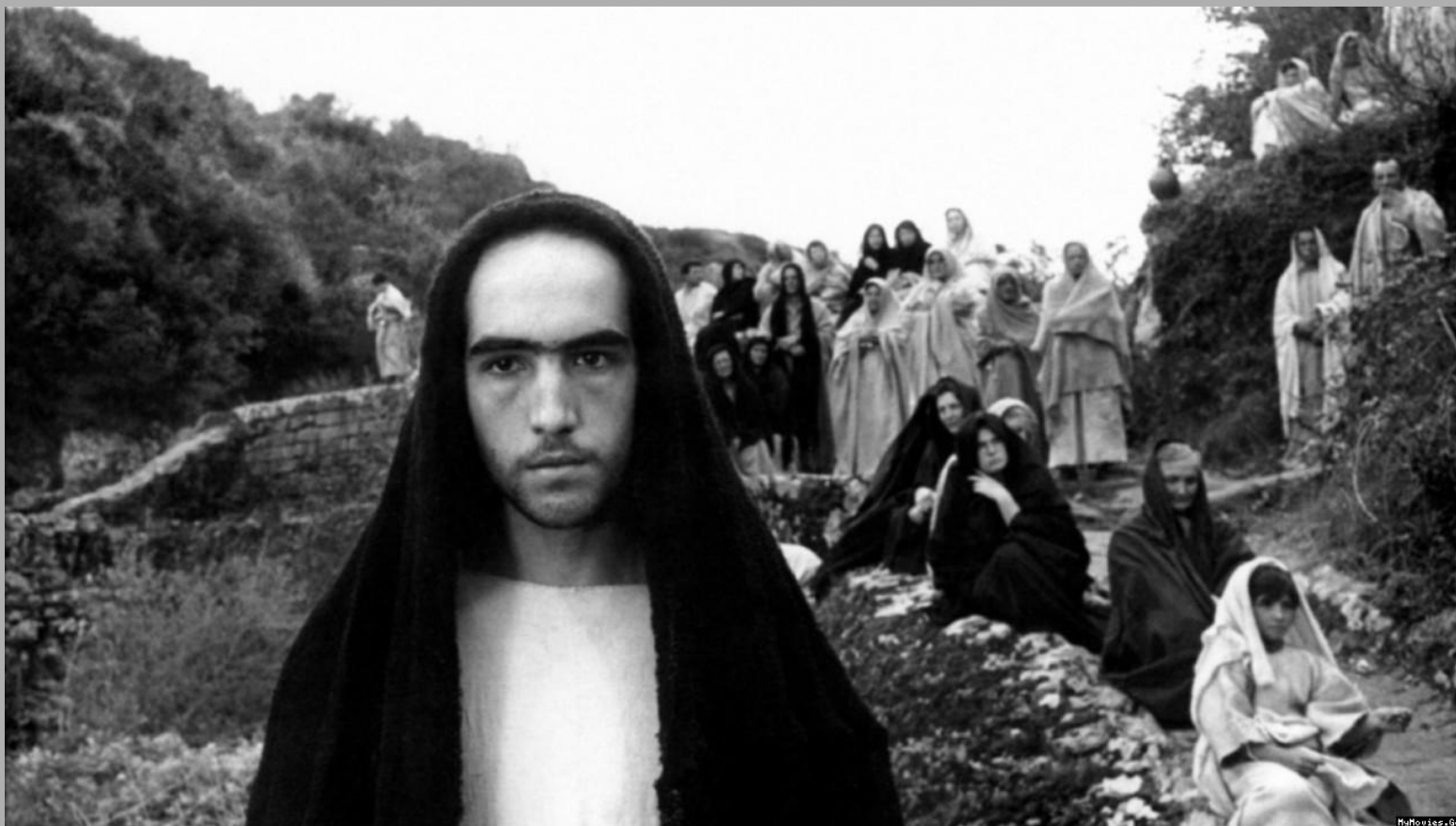
P.P. Pasolini, Il Vangelo secondo Matteo