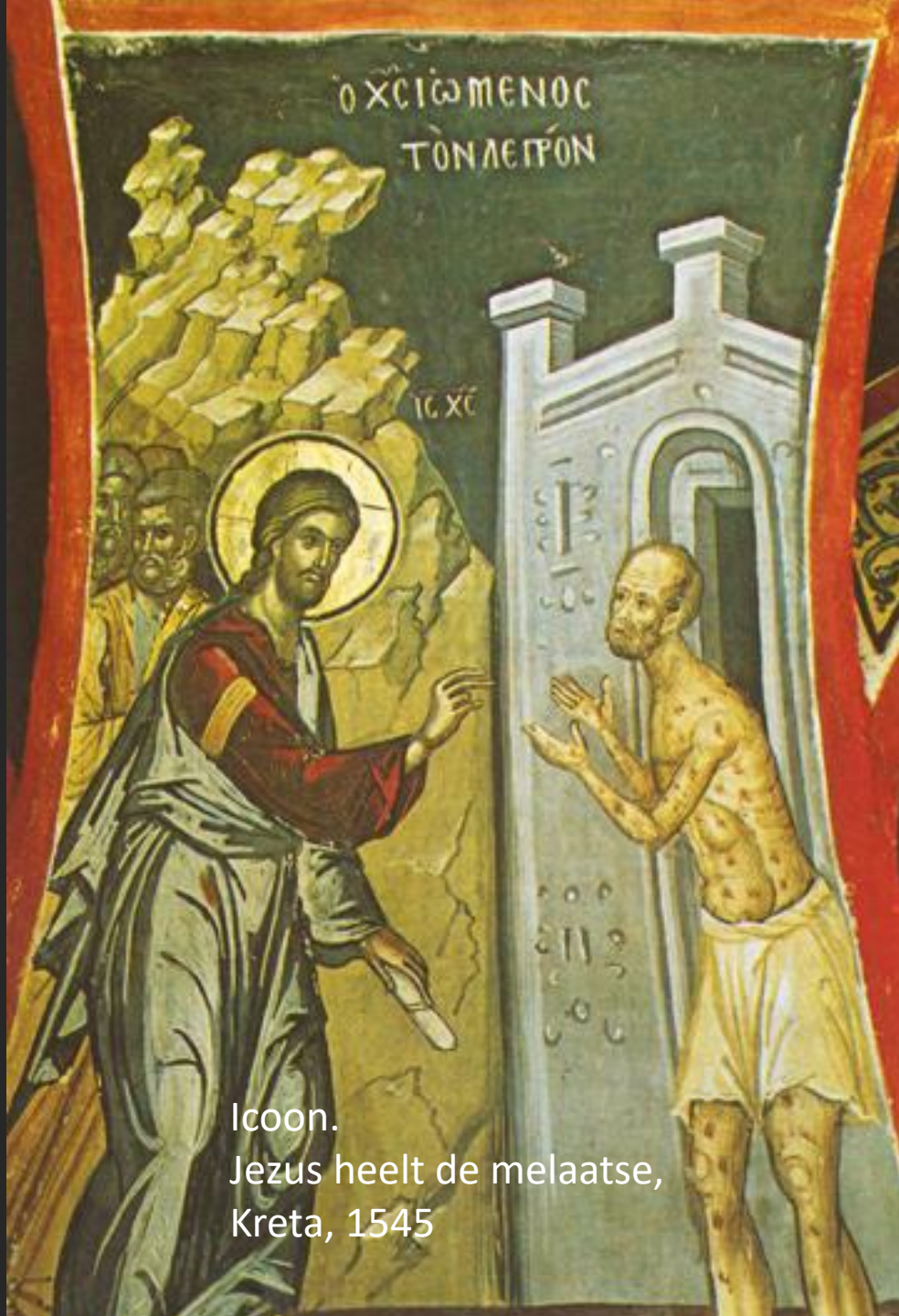
Icoon. Jezus heelt de melaatse, Kreta, 1545