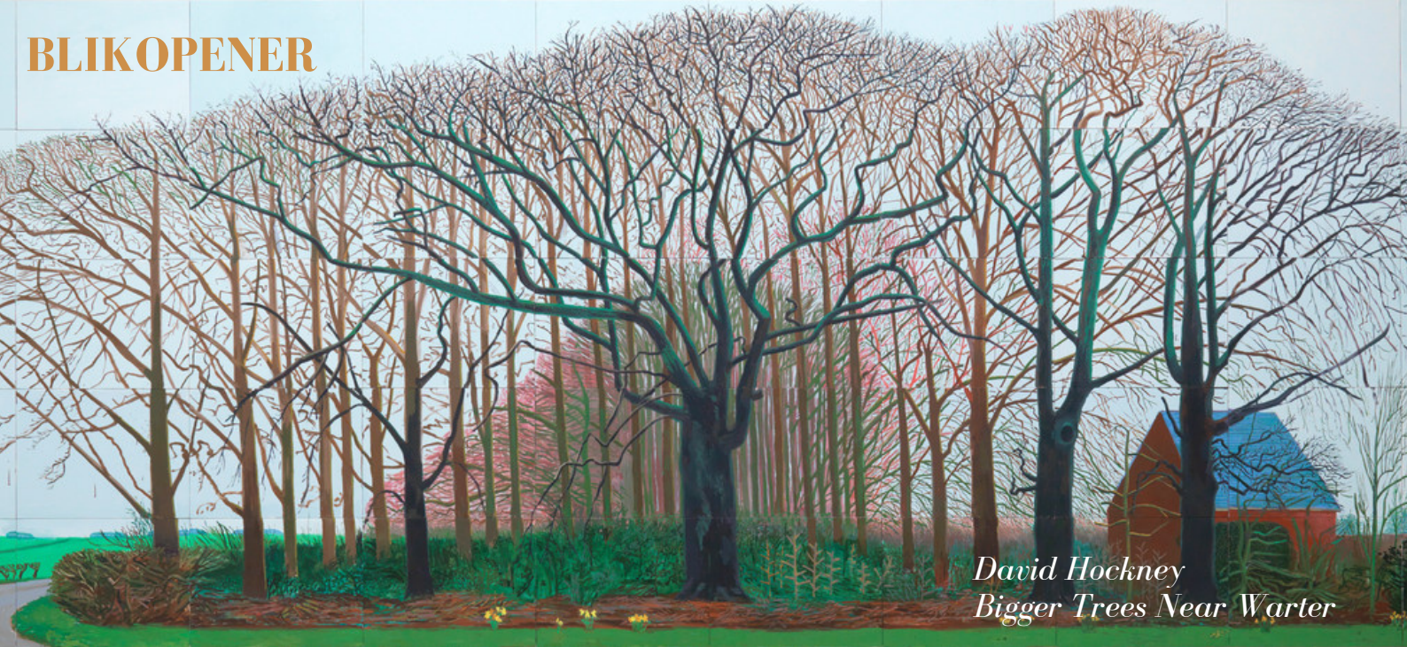
David Hockney Bigger Trees Near Warter