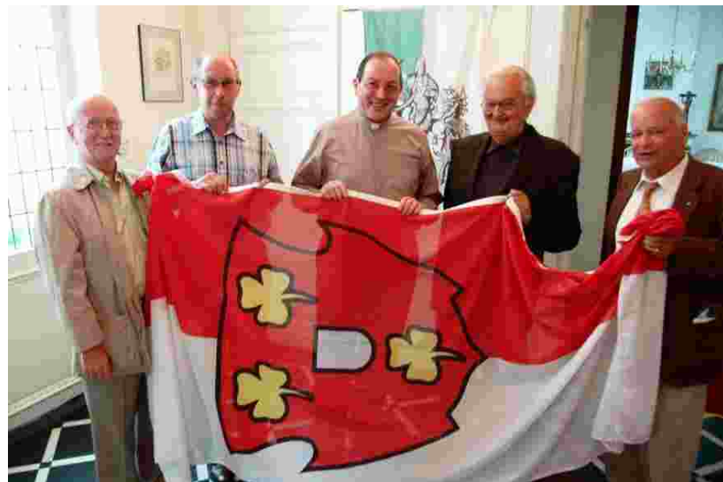
Overhandiging van de vlag van Kleve (Ronse, 28.9.2010)