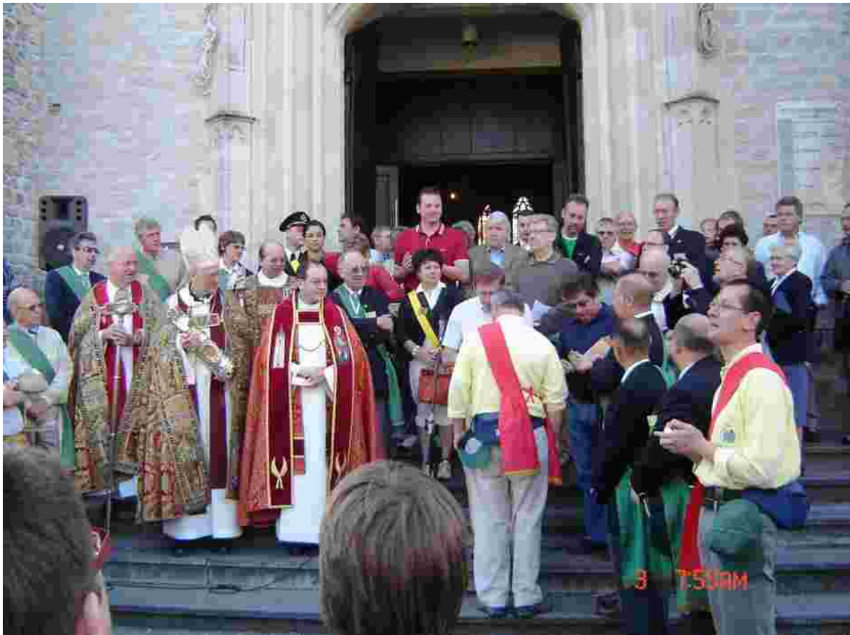
Openingsceremonie op Drievuldigheidszondag 3 juni 2007 (11 jaar eerder!), waarna processie in de binnenstad.