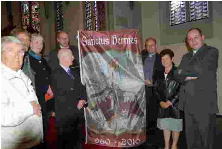
Overhandiging van het jubileumvaandel (Kleve-Warbeyen, 26.5.2010)