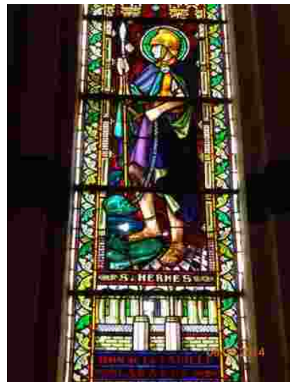
De Sint-Hermeskathedraal in Lisala, met glasraam van de patroonheilige