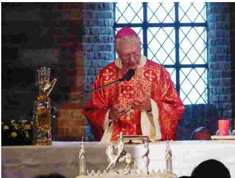
Op 28 augustus wordt de marteldood van Sint-Hermes ieder jaar in de Crypte ingetogen herdacht. Ook deze viering kreeg herhaaldelijk – in 2013, hier in 2018 – bisschoppelijke aandacht en steun.