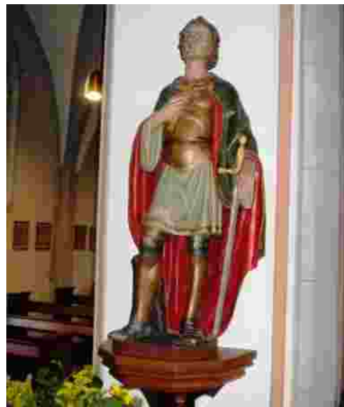
De Sankt Hermeskirche en haar patroonsbeeld in Warbeyen-Kleve