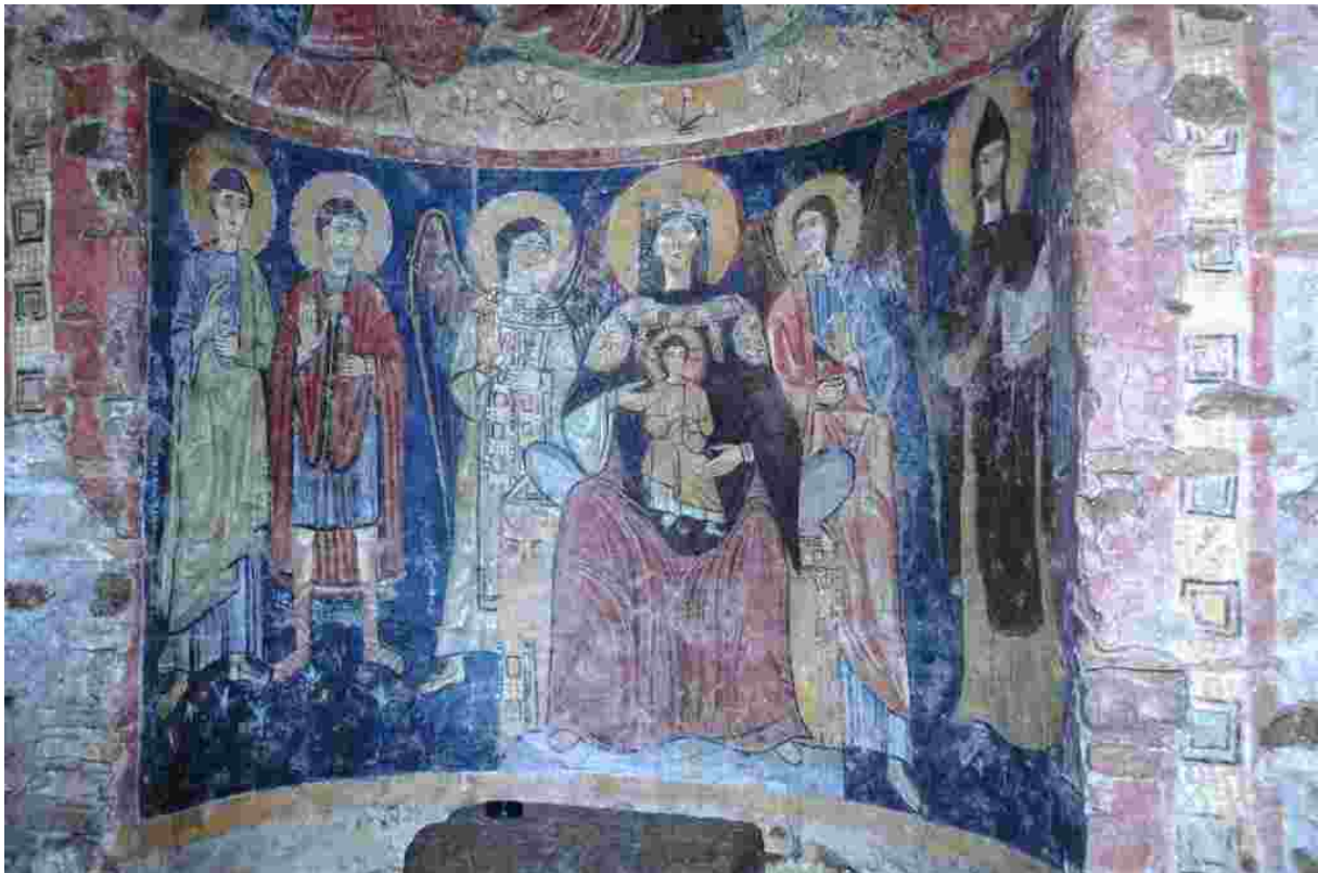
Fresco in de Catacomba di Sant'Ermete, met de oudste afbeelding van Sint-Hermes (tweede van links)

Het document somt een aantal voorwaarden voor de erkenning op (art. 7-10). De voorgedragen kerk moet een levendig en voorbeeldig centrum van katholieke eredienst zijn, met voldoende ruimte en passend, volgens de richtlijnen van Vaticanum II, ingericht. Ze moet een zekere bekendheid genieten, bijvoorbeeld door de aanwezigheid van de relieken van een heilige. Haar historische en artistieke waarden zijn eveneens van belang. Voldoende bedienaars, bijzonder voor het vieren van de Eucharistie en het sacrament van de verzoening, moeten beschikbaar zijn en ook een zangkoor om de deelname van de gelovigen aan de diensten te ondersteunen.