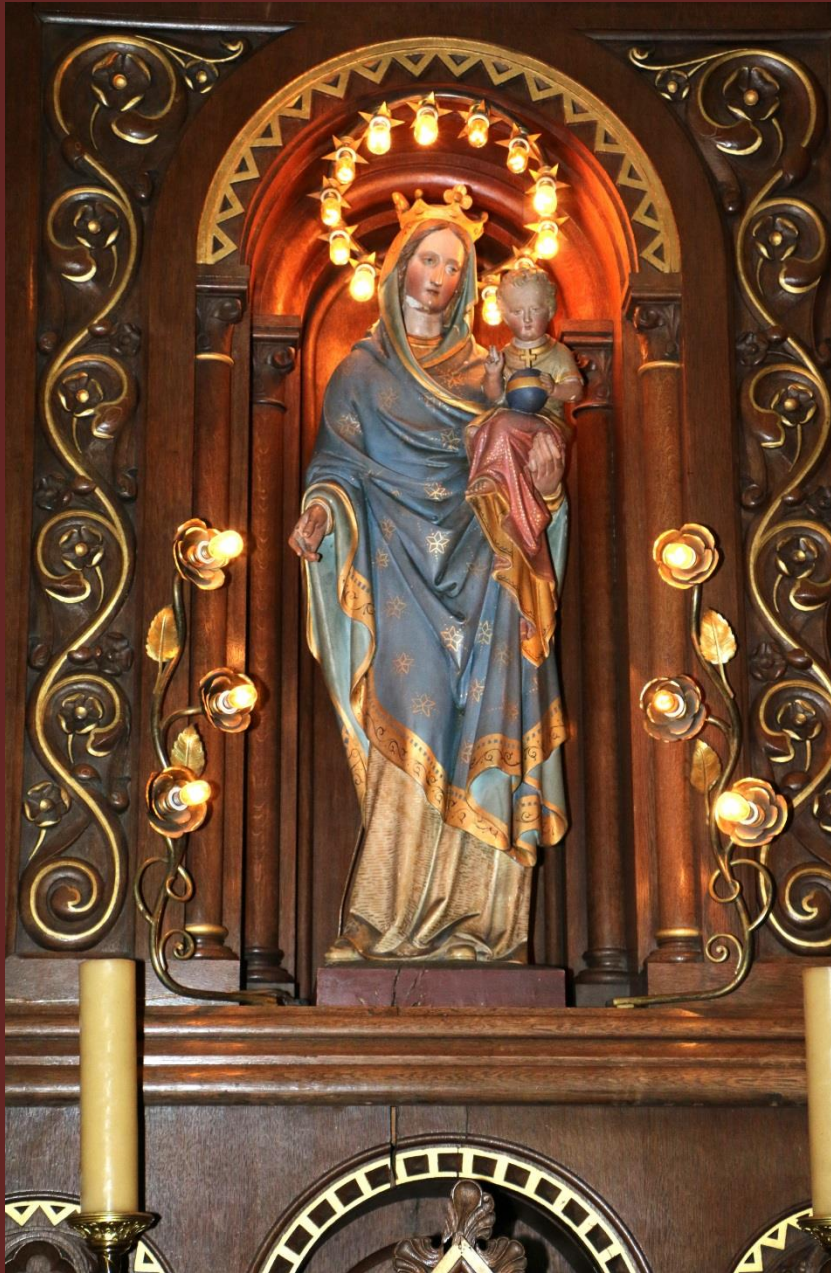
Linker zijaltaar: H. Maria met kind