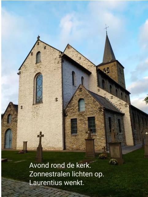
Avond rond de kerk. Zonnestralen lichten op. Laurentius wenkt.

Zoals we weten drongen zich rond 1990 voor de kerk zeer grote restauratiewerken op door instabiliteit van het torengebouw. Hierbij diende de kerk voor een paar jaren gesloten te worden en werd een houten noodkerk in gebruik genomen. Deze restauratiewerken, omstreeks 2000, gingen gepaard met uitgebreid archeologisch onderzoek en de kerk werd toen grotendeels weer in haar oorspronkelijke Ottoonse stijl hersteld.