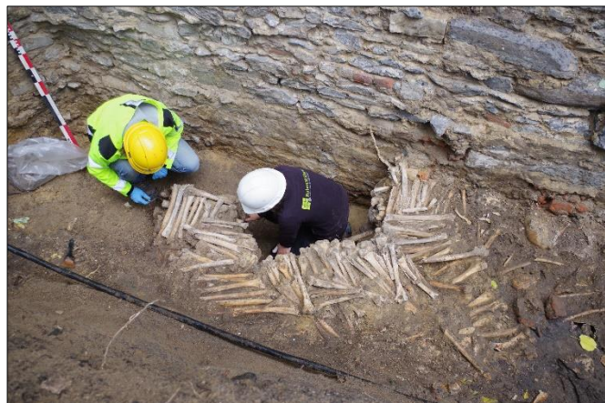
Figuur 2. Vrijleggen van de muurtjes

Voor Vlaanderen is deze vondst uniek: er is immers geen vergelijkingsmateriaal voorhanden. Op (middeleeuwse) begraafplaatsen komen vaak tal van knekelpakketten en -putten voor, maar het gaat dan meestal om niet-gesorteerd botmateriaal, doorgaans van groter formaat, dat ordeloos gedeponeerd werd. Op de site rond de voormalige Sint-Janskerk werd daarentegen een duidelijke selectie gemaakt binnen het grotere beendermateriaal, bovendien in functie van het geordend opbouwen van een structuur.