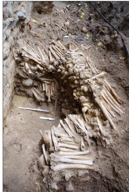
Figuur 3. Zicht op de muurtjes opgebouwd uit lange beenderen

Labo-analyses hebben aangetoond dat het botmateriaal waaruit de knekelmuurtjes opgebouwd zijn, hoofdzakelijk dateert uit de tweede helft van de 15de eeuw. Op basis van het aardewerk dat geassocieerd is met de knekelmuurtjes wordt momenteel aangenomen dat het om een ruiming gaat uit de 17de of de eerste helft van de 18de eeuw, die niet in de bronnen vermeld wordt. Deze hypothese moet nog bevestigd worden door verder onderzoek.