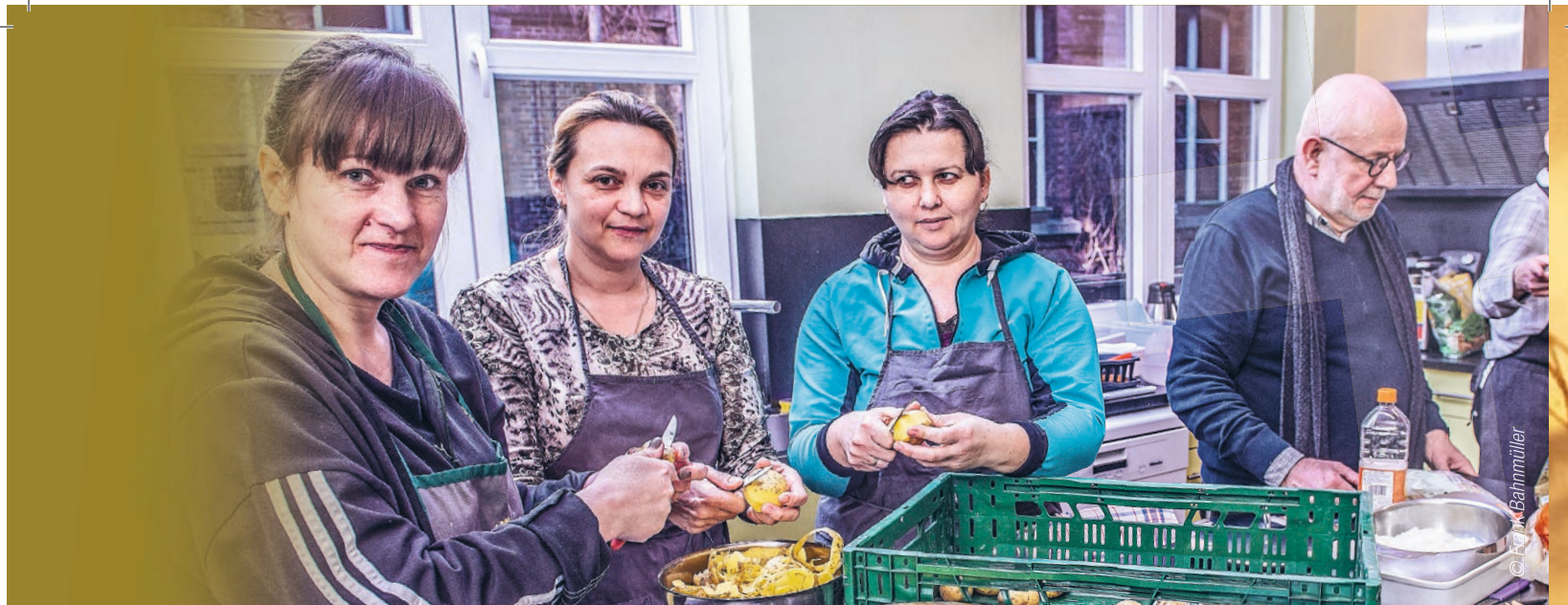
› Op de Ossenmarkt in Antwerpen helpen Oekraïense mama's de paters een handje in de keuken.