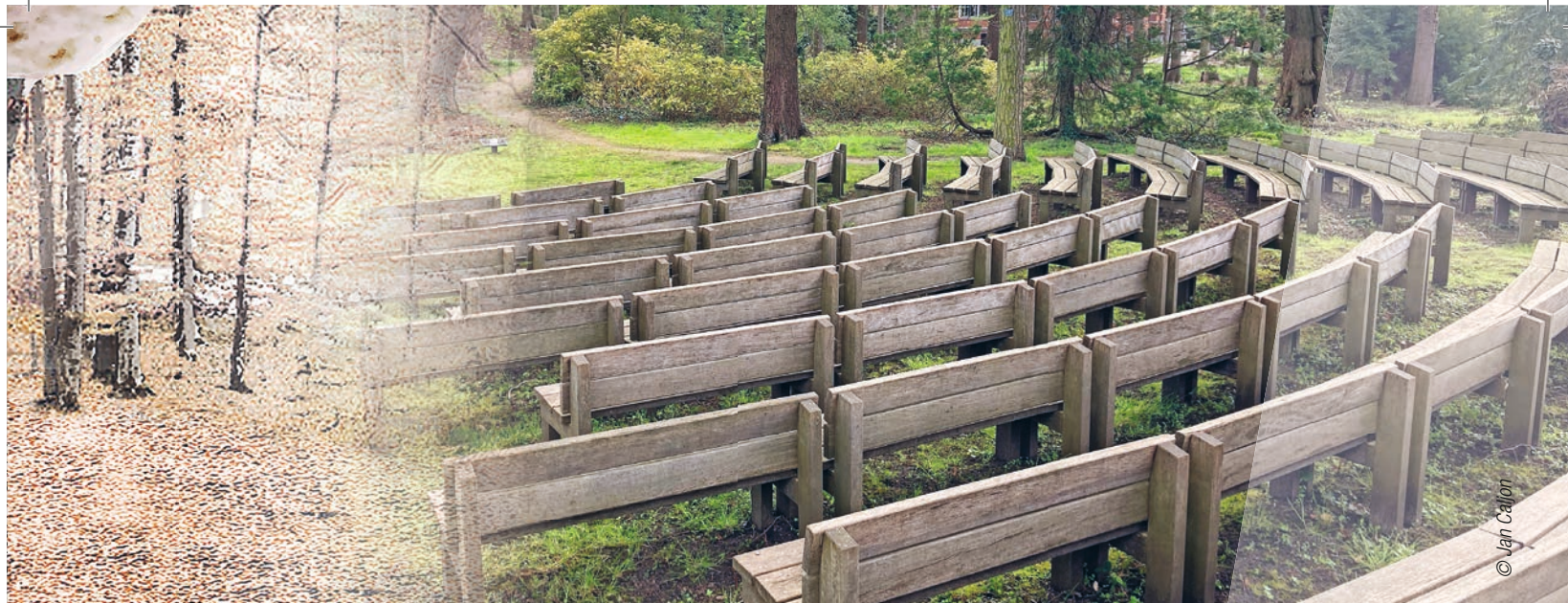
› De buitenkathedraal, opgericht in 2005, werd ingezegend door toenmalig deken Hans Vanackere.

te voldoen aan het legaat en waren bereid om een mooie plek in Herentals te creëren. De visie van de bouwmeester, het masterplan en de tijd om ideeën te laten rijpen, maakten dat alle partijen gereed waren om het idee van een klassieke kerk los te laten. Het werd de start van een intensief, niet altijd eenvoudig maar mooi traject.”