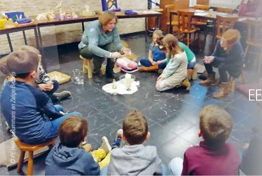
© PE Heilige Gummaris en Zalige Beatrijs