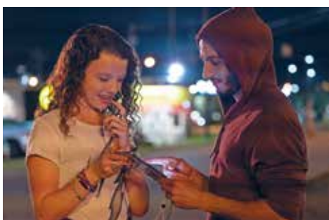
► Beelden uit 'Messiah'.

gemak over water. Hij geeft nooit een rechtstreeks antwoord, maar beantwoordt elke vraag met een wedervraag, een raadsel of stilte. Zo kan de kijker gemakkelijk verschillende identiteiten kleven op deze raadselachtige man. De grote vraag is dan ook: Is al-Masih de Messias of niet? (Marjolein Bruyndonckx)