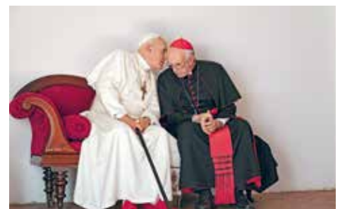
► Een beeld uit 'The Two Popes': Paus Benedictus XVI fluistert iets in het oor van kardinaal Bergoglio, de huidige paus ...