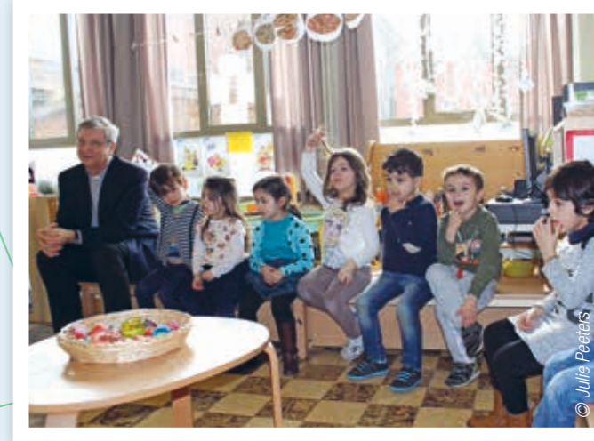
Luisteren met open oren naar kinderen en jongeren om met hun scherpe blik te kunnen kijken.

Op vakantie in Frankrijk. In elk kerkportaal hangt een overzicht van alle gebedsdiensten in de lokale pastorale eenheid. Deze zondag is de viering maar vijftien kilometer verder. "C'est tout près", zeggen ze. Wat in Frankrijk zoveel betekent als "A une demi-heure d'ici." Ik beland in een kleine, middeleeuwse parochiekerk en zet me incognito tussen de andere gelovigen. Ongelijke vloertegels, gammele stoelen, zwakke verlichting, ruim voldoende spinnenwebben, een jonge Afrikaanse priester, gelovigen van ter plaatse en van elders, enkele opvallend mooi geklede families met kinderen die vooraan knielen, voor iedereen een gerecycleerd A4'tje met de liederen, vriendelijke blikken over en weer, een lange vredeswens: dat is 'God in Frankrijk' anno 2018.