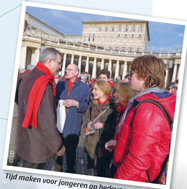
Tijd maken voor jongeren op bedevaart in Rome.