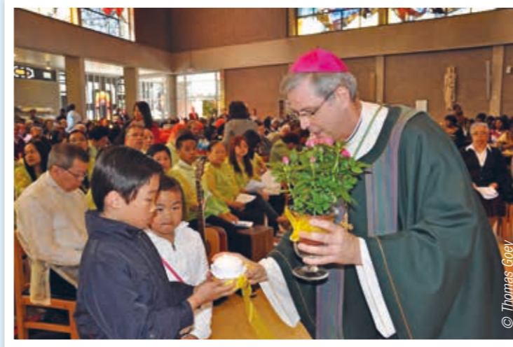
Betrokken op de wereldkerk in ons bisdom.

Op bezoek in Syrië. Met medewerkers van Caritas wandel ik door het verwoeste oostelijke deel van Aleppo. Zover je kan kijken, overal ruïnes. Zowel de mooie brede winkelstraten vooraan als de arme volksbuurten erachter: alles is met de grond gelijkgemaakt. We bezoeken een wijk waar opnieuw enkele mensen wonen, in de bouwval van ingestorte huizen. Als dieren in verlaten stallen. Meestal moeders met enkele kinderen. Een moeder laat me binnen. Ze zet een mand opzij met enkele resten van schoenen en plastic. De kinderen verzamelden het tussen het puin. Het is haar brandstof om te koken en de kamer te verwarmen. In welke wereld leven wij?