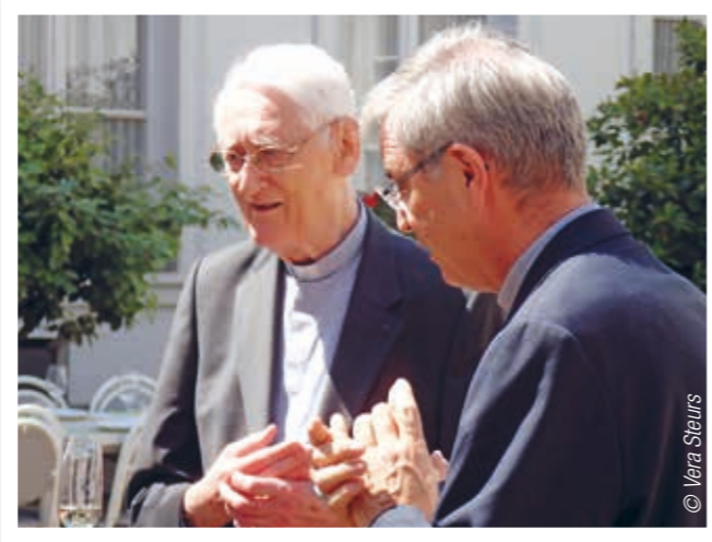
Een herder in de lijn van het verhaal dat God schrijft met mensen en met ons bisdom.