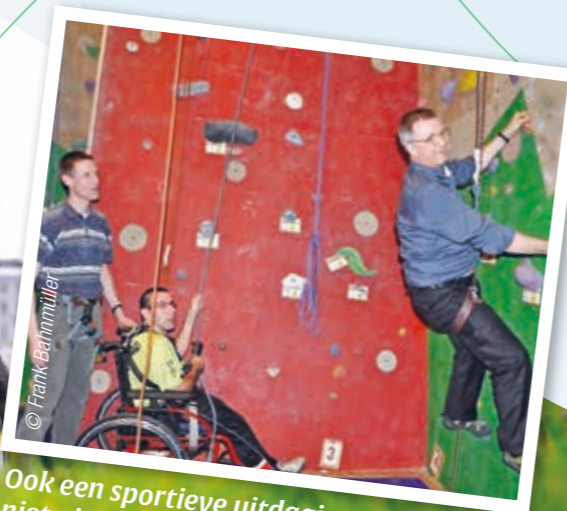
Ook een sportieve uitdaging gaat hij niet uit de weg.

Een jonge kerel op de stoep. Het is bisschoppenconferentie. De hele donderdag lang. Ik ben moe en niet in de beste stemming. Ik wil mijn gedachten verzetten al kokend. Dus steek ik de straat over om wat inkopen te doen in de supermarkt. Op de stoep spreekt een jonge kerel me aan. Hij moet vooraan in de twintig zijn. "Zijt gij de bisschop? Ik wil je iets vragen. Enkele jaren geleden liet ik me hier – hij wijst naar het bisschopshuis – uitschrijven uit de kerkregisters. De pedofilie was er voor mij echt te veel aan. Nu heb ik gelezen wat je geschreven hebt over het huwelijk en het gezin. Ik wil me opnieuw laten inschrijven. Hoe doe je dat?" Soms staat er een engel op je weg. Gezonden van hierboven, denk ik dan.