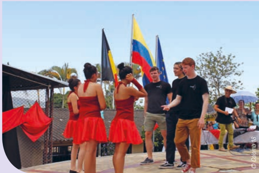
› Een vlaggen ceremonie als welkom en verbroedering.

doodop, maar het warme onthaal – letterlijk het hele dorp was bijegekomen om ons te verwelkomen – gaf ons een heuse boost.”