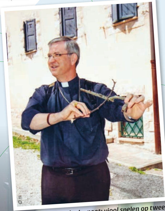
Altijd in voor een leuke noot: viool spelen op twee takken in de voetsporen van Franciscus naar Assisi.