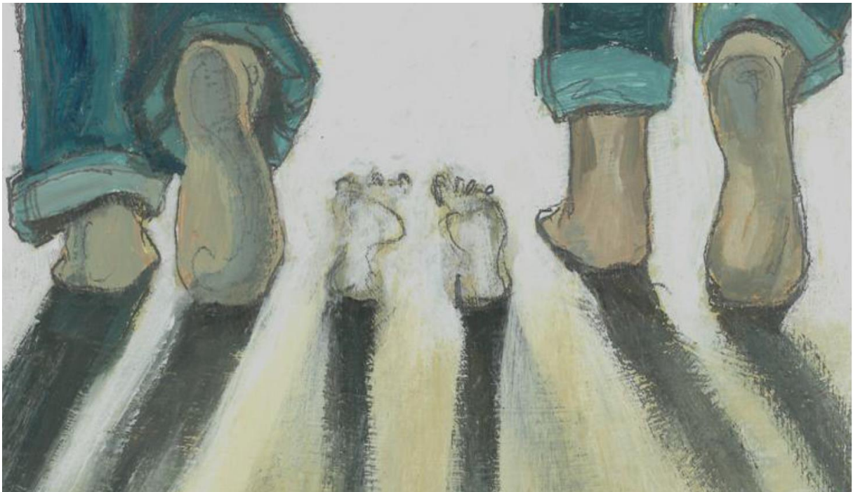
Leeftocht Katholiek Onderwijs Vlaanderen – jaarthema-affiche