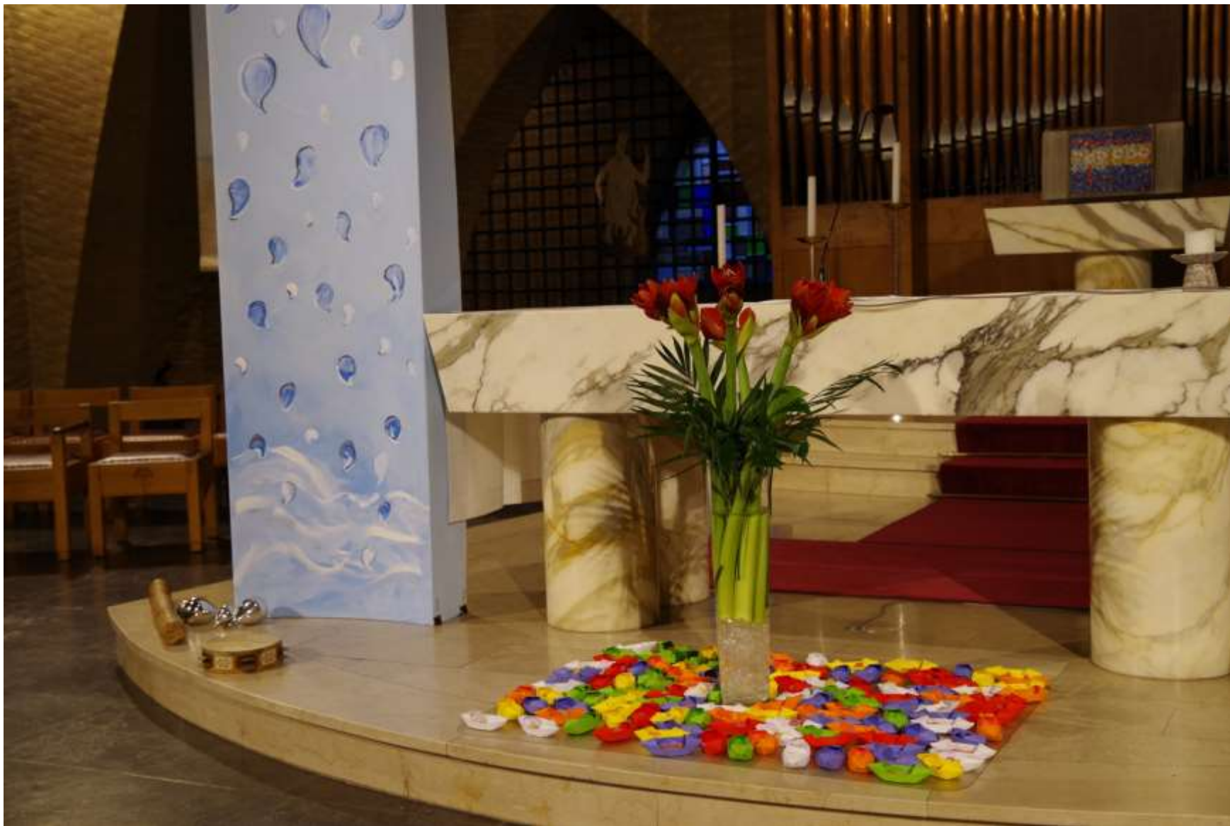
bootjes met visjes (Ichtus)