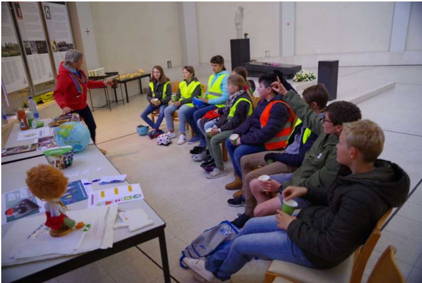
in gesprek met iemand van de werkgroep diaconie