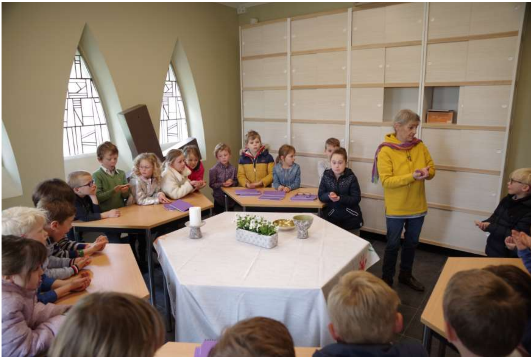
korte nevendienst voor de kleinsten