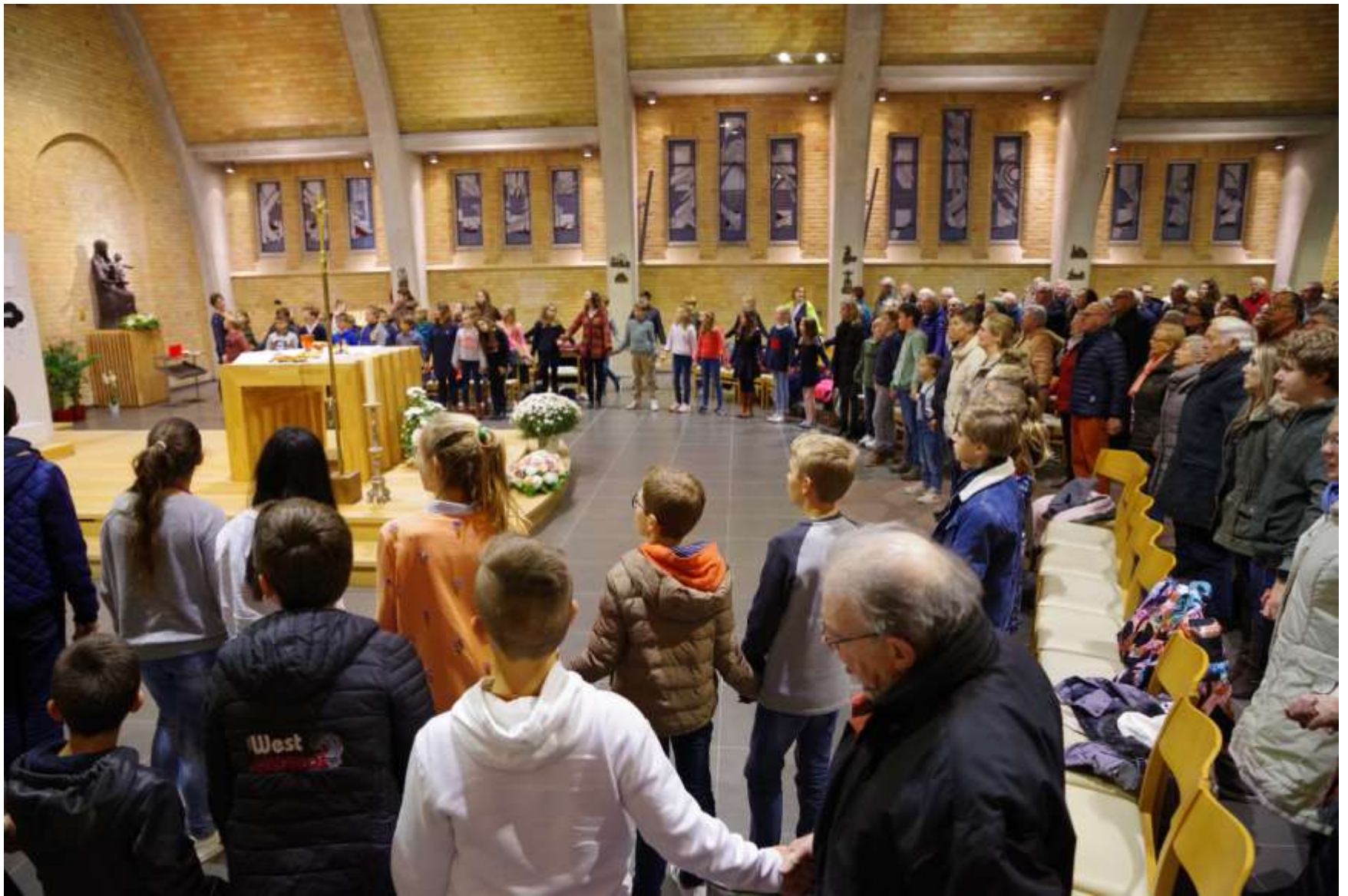
jongeren zijn welkom in Sint-Idesbald