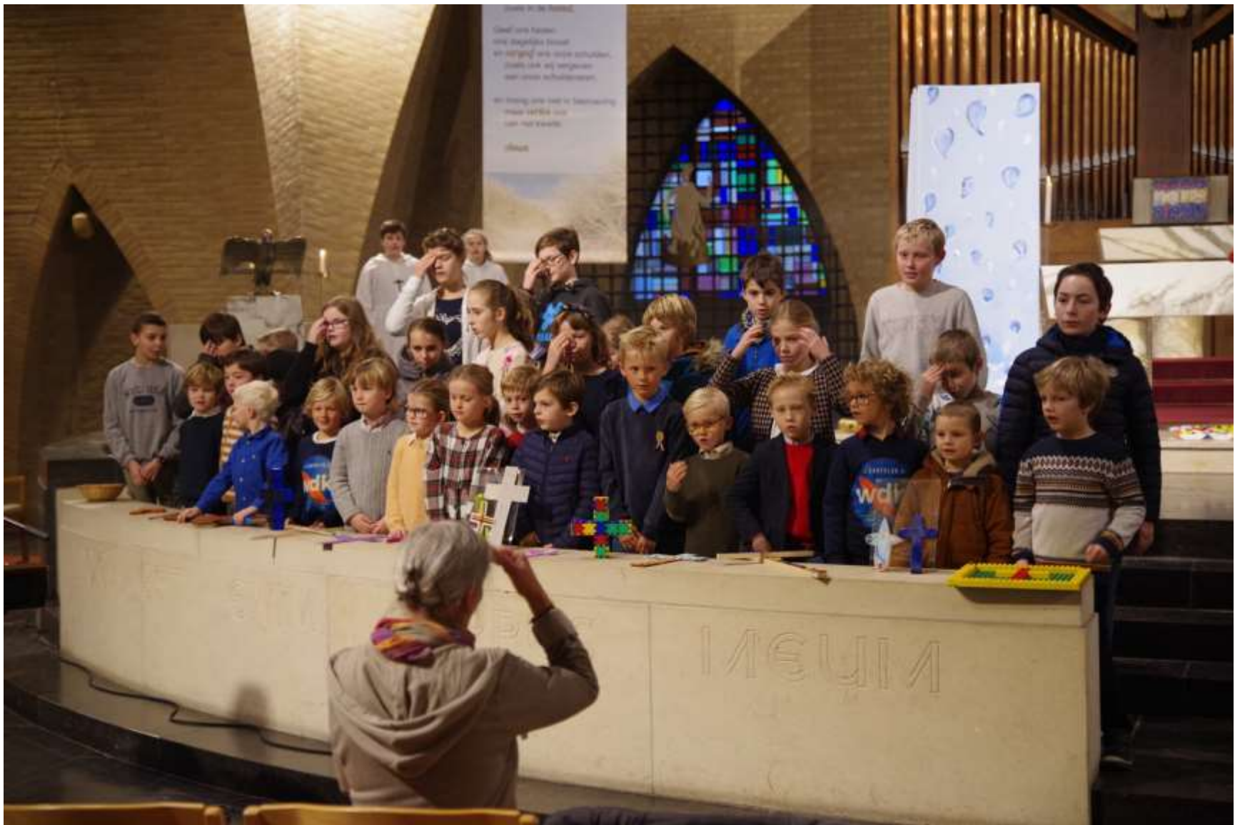
samen een kruisje maken